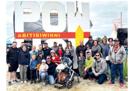
Pow-wow de la communauté Abitibiwinni