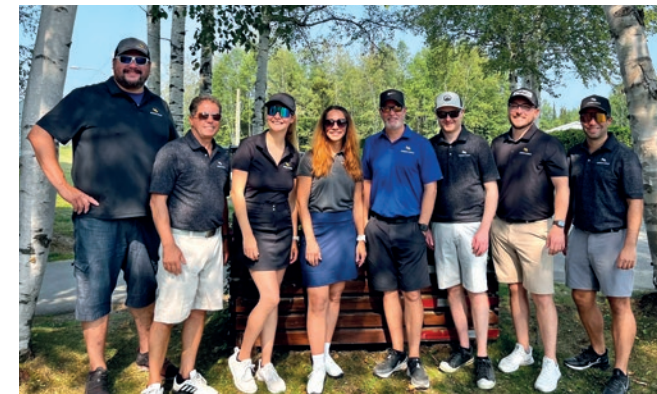
Classique de golf Takwakin du Conseil de la Nation Anishnabe de Lac Simon tenue au Club Sports Belvédère

Les deux événements visent à soutenir les activités offertes aux jeunes de la communauté et à développer leur potentiel!