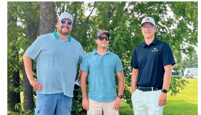
Classique de golf Abitibiwinni tenue au Club de golf l'Oiselet d'Amos