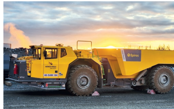
Le modèle ayant servi aux tests de téléopération.