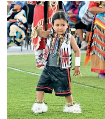
Pow-wow de Lac Simon