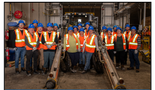
La visite de la mine Odyssey