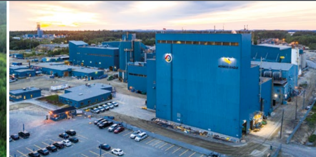
Mine LaRonde et Mine LZ5