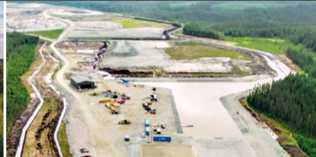
Mine Akasaba Ouest