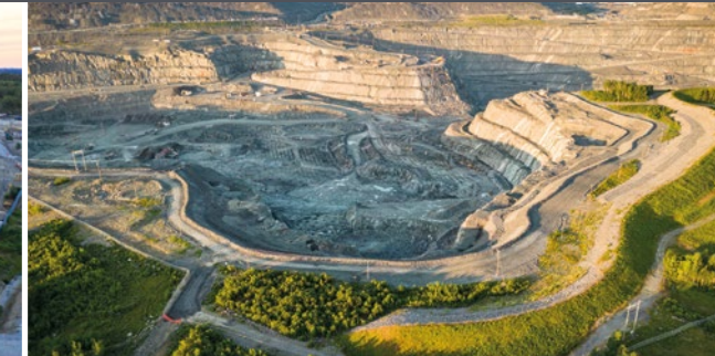
Mine Canadian Malartic