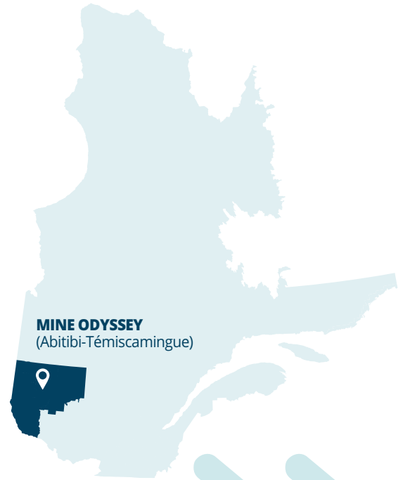
MINE ODYSSEY (Abitibi-Témiscamingue)

La mine Odyssey, dont les travaux de construction sont débutés, mettra en valeur la continuité du gisement des fosses Canadian Malartic et Barnat par l'entremise de quatre principales zones minéralisées en profondeur. Nous deviendrons l'une des plus importantes mines d'or souterraines au Canada. Nous sommes situés à environ 3 km à l'est de l'entrée de la ville de Malartic.