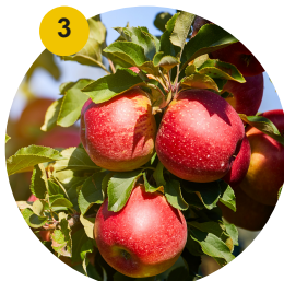
3 Pommier rouge