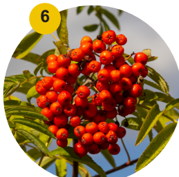
6 Sorbier Cardinal