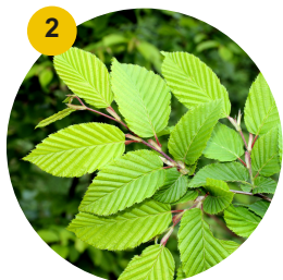
2 Orme d'Amérique