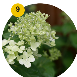
9 Hydrangée limelight