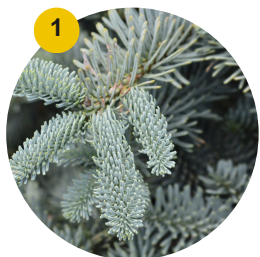
1 Épinette bleue