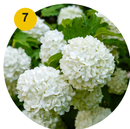
7 Viorne à boule de neige