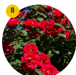
8 Rosier champlain rouge