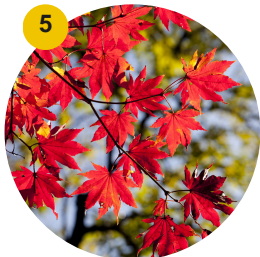
5 Érable rouge