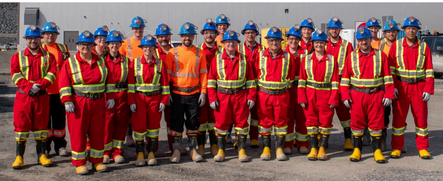
Photo prise lors de la visite du site de la mine Odyssey le 12 juin 2024.