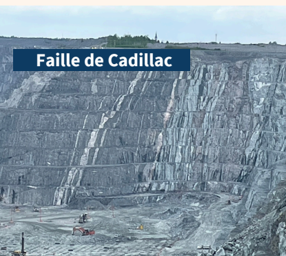
Faille de Cadillac

des participant.e.s ont indiqué avoir beaucoup apprécié l'activité.