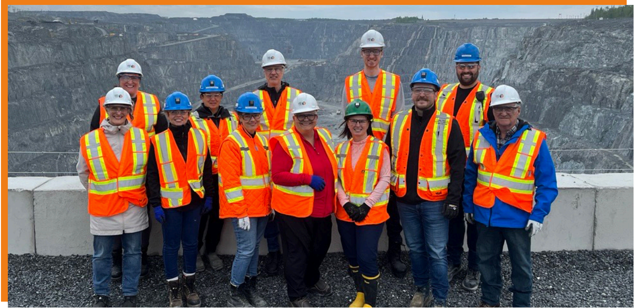
Photo prise lors de la visite du site de la mine Canadian Malartic, le 11 juin 2025.