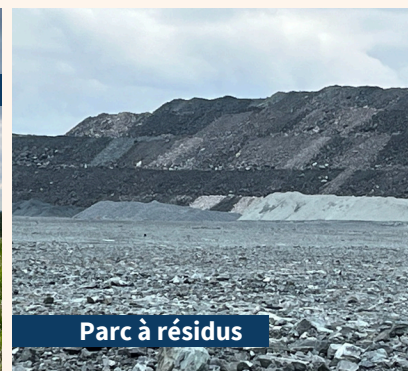
Parc à résidus