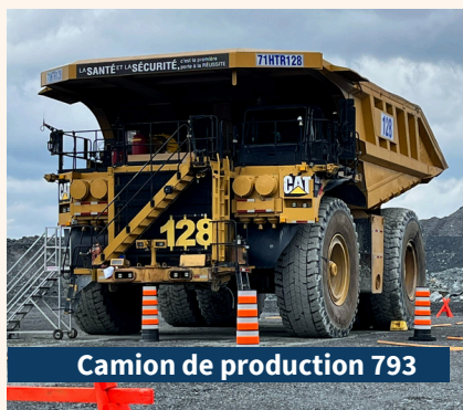
Camion de production 793