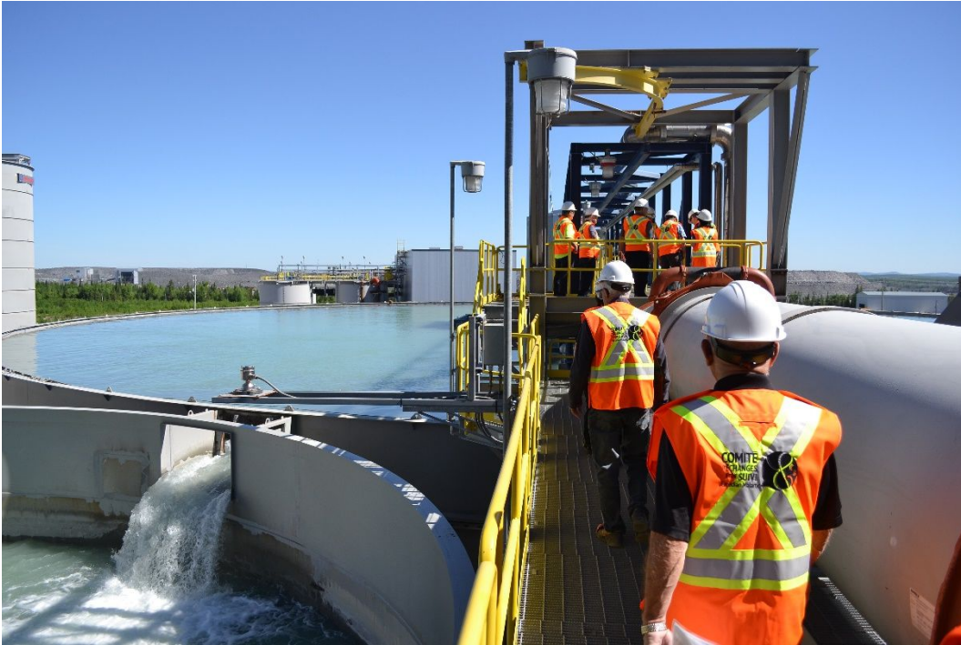
Visite du site minier en juin 2018 sur le thème de la gestion des eaux

MCM a réalisé une présentation complète de la gestion de l'eau potable, des eaux souterraines et de l'eau sur le site minier. À cette occasion, l'entreprise a présenté son plan d'urgence en cas de déversement, d'incendie et d'affaissement de la digue ou de rupture du barrage.