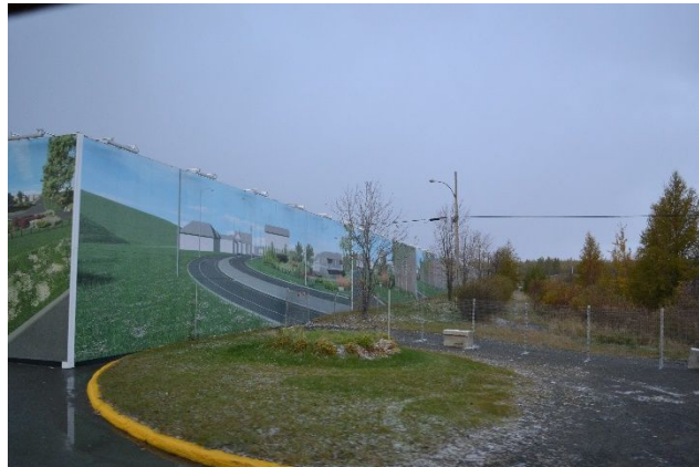
Visite du Projet Extension Malartic en octobre 2018

Dans le cadre du projet d'extension qui comprend la déviation d'un tronçon de la route 117 et l'extension de la fosse Canadian Malartic, le CES-CM a demandé à MCM de le tenir informé tant sur le projet que sur les communications qui sont envisagées auprès de la communauté. MCM a présenté un plan de la voie de contournement et une vidéo (accessibles sur le site internet communaute.canadianmalartic.com ).