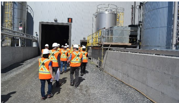
Visite du site minier en juin 2018 sur le thème de la gestion des eaux