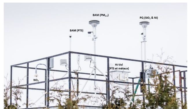
Vue extérieure d'une station de mesure de la qualité de l'air

MCM a présenté ses outils et protocoles de mesure, ses résultats d'analyse et ses interventions pour diminuer les quantités de poussières.