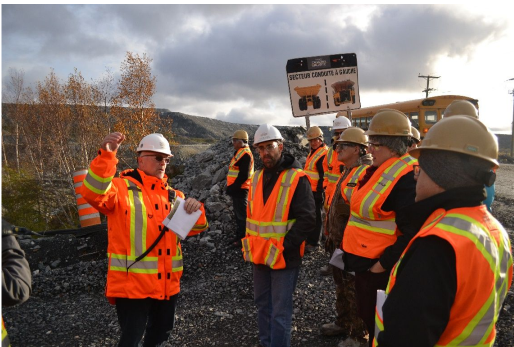
Visite du site du projet Extension Malartic par les membres du comité en octobre 2018

* Les sièges du CES-CM sont destinés dans l'ordre aux personnes de Malartic, de Rivière-Héva et de Dubuisson, puis à celles de l'Abitibi.