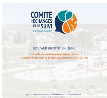
Site internet du CES-CM

personnes-ressources du CES-CM pour commentaires et approbation. Une fois validé, ce compte-rendu devient public et accessible sur le site internet cescm.ca .