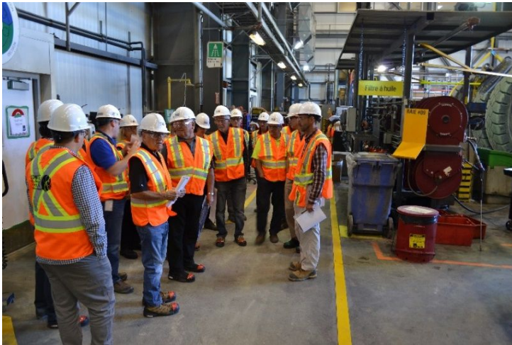
Visite du site minier en juin 2018 sur le thème de la gestion des eaux

L'année 2018 marque la première année d'existence du Comité d'échanges et de suivi Canadian Malartic (CES-CM). Ce document constitue ainsi son premier rapport d'activités.