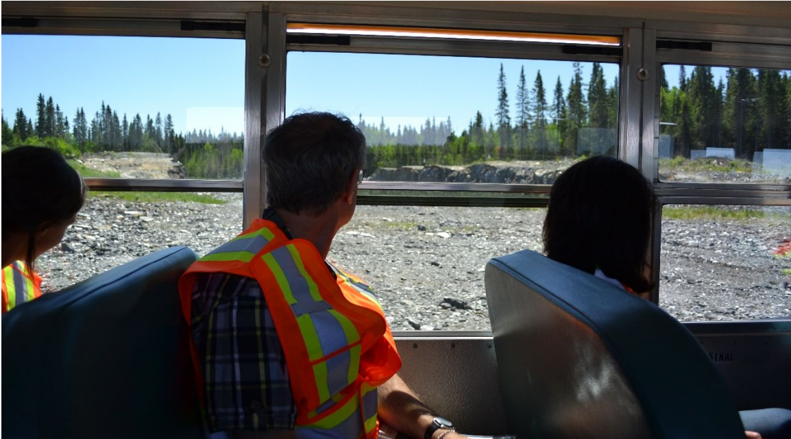
Visite du site minier en juin 2018 sur le thème de la gestion des eaux